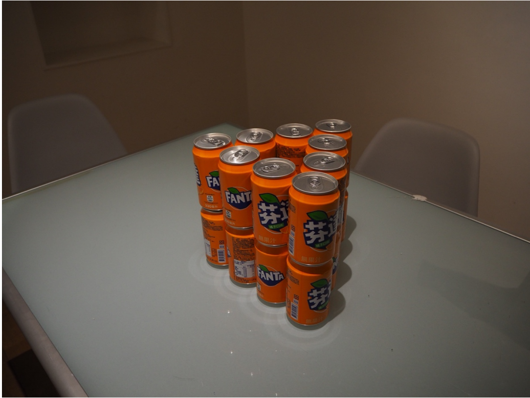
放置於會議桌中心的氣泡飲料芬達 (Fanta) 。

你口渴了嗎？包裝絢麗的氣泡飲料芬達 (Fanta)在這個展場裡，究竟是什麼樣的角色？「Fantasy」帶有寄望、臆想、好奇心之意。對我來說，「展覽」是一把引領「趣味」、「好奇心」的鑰匙。藝術家藍仲軒如何運用歷史事件，打造他身為藝術創作者心中堅信的「Fantasy」。一個以現成物展示、陳列為主的展覽，對觀眾來說，若沒有對二戰歷史、或是台灣在這六十年內的身份轉變，有一定的觀察和了解，會如同玩撲克牌大老二的玩家那樣，需要點運氣，看藝術家是否在現場能親自做導覽，抑或是觀眾「求知若渴」，可以藉由「求知慾」去閱讀進而分析這些物件所帶出的含義。